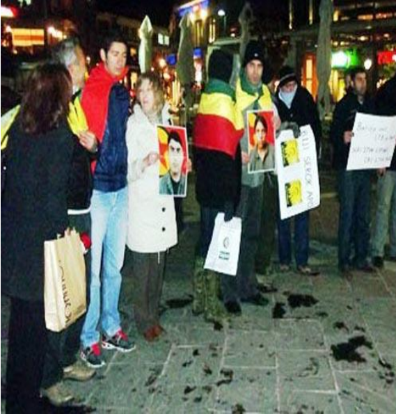
PKK sempatanlarının Batı Trakya'daki şehitleri anma mevlidine yönelik protesto eylemi ve bildirisi.