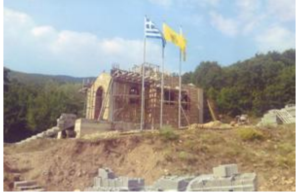
Azınlığa ait vakıf arazisi üzerinde yapılmakta olan kilise inşaatı

yaptırılan çeşme 24 Temmuz 2009'da yıkıldı. Yıkım kararının Doğu Makedonya Trakya Bölge sekreterliği tarafından alındığı belirtiliyor. 76