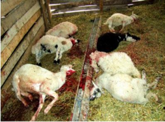
Saldırı sonucu telef edilen koyunlar

-2008'de vakıf arazileri hakkında, azınlığa ait arazileri yine azınlığın yönetmesini kabul eden karar uygulamaya konulmadı.